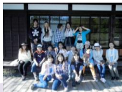
アルプス公園で ピザ焼いて食べる会